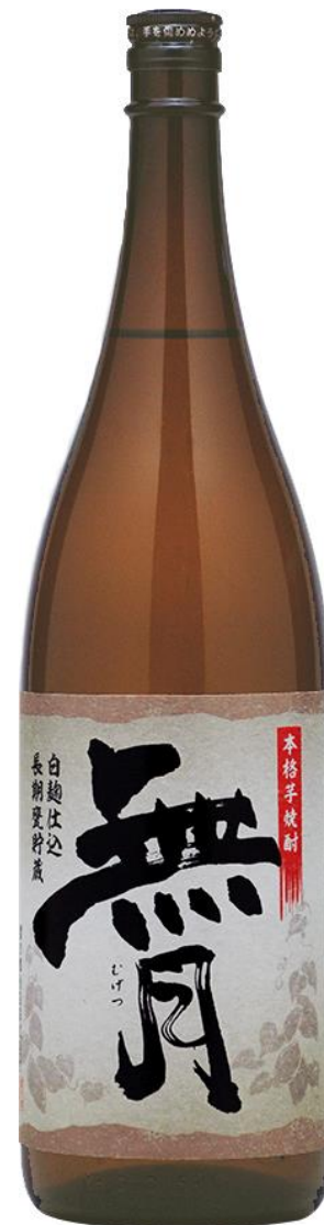
(新価格) 1.8L : 2,280円