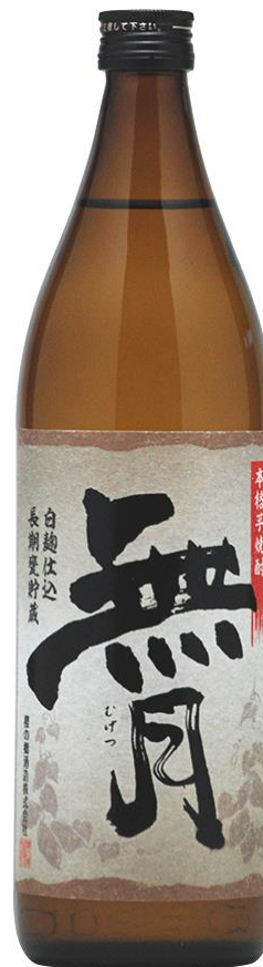
(新価格) 900ml : 1,180円