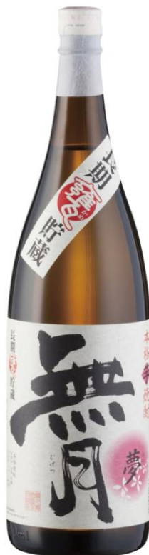
1.8L : 2,380円