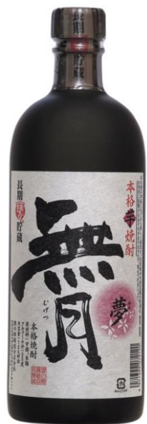
720ml : 1,400円

「無月 夢」を終売とし、新たに「無月 白」を発売致します。 ラベルもリニューアルし、三年長期貯蔵の酒質はそのままに、 容量は720mlから900mlに増量となります。また、価格は お求めやすい新価格となります。